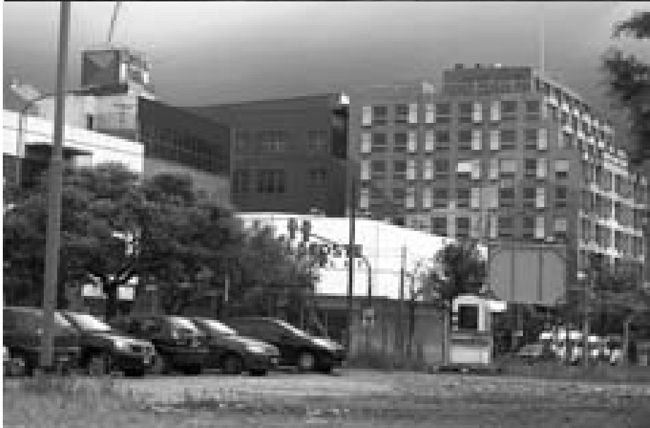
TOMA Y DACA. Los terrenos donde debía construirse la Ciudad Deportiva de Boca hoy es un proyecto inmobiliario privado. Abajo, el bajo autopista convertido en estacionamiento del Central Park.