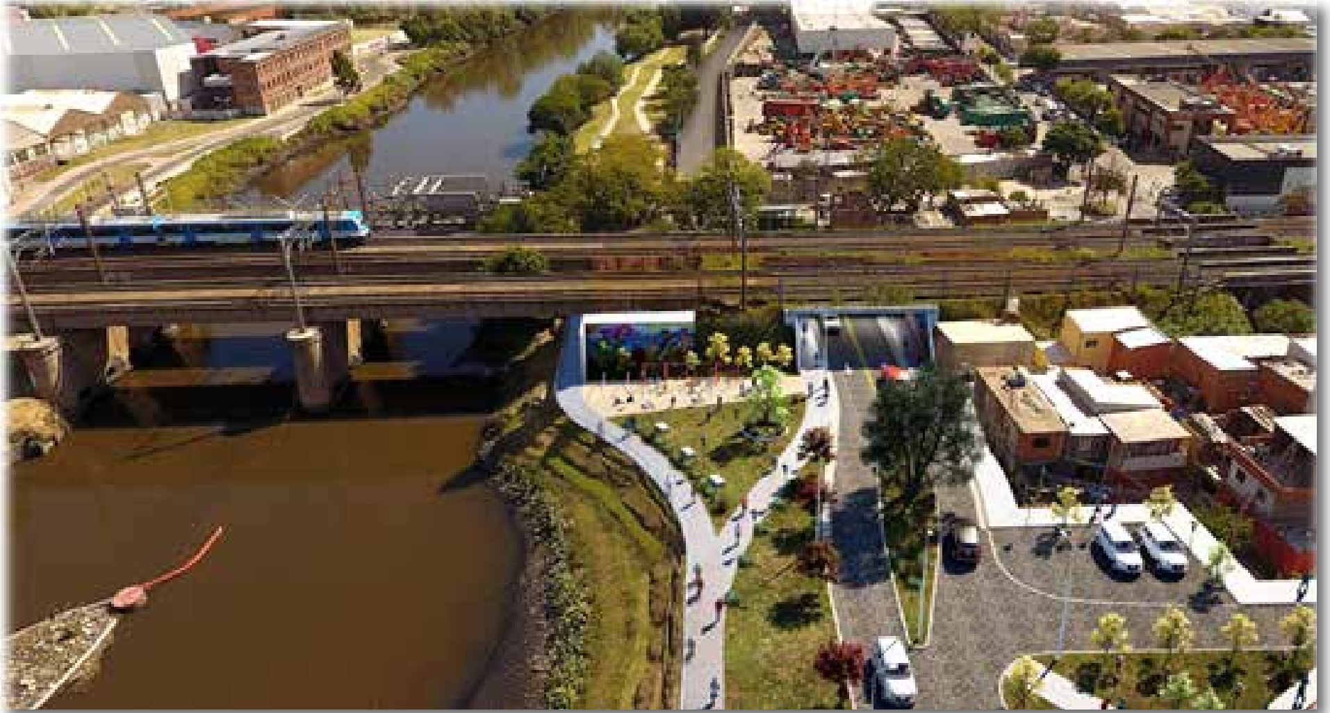
Así quedaría el bajo puente, según las maquetas que están en la web del Gobierno porteño.

de velocidad. Sino, el barrio puede ser una alternativa para que pasen los camiones y rompan los caños, como ya pasó”, detalló el arquitecto, quien afirmó que el representante de Infraestructura “asumió el compromiso” de hacerlo.